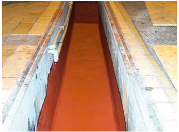
Canal para sustancias químicas

Belzona 4181 se adhiere a una amplia gama de sustratos que incluyen: hormigón, ladrillo, mármol, piedra y muchas otras superficies rígidas.