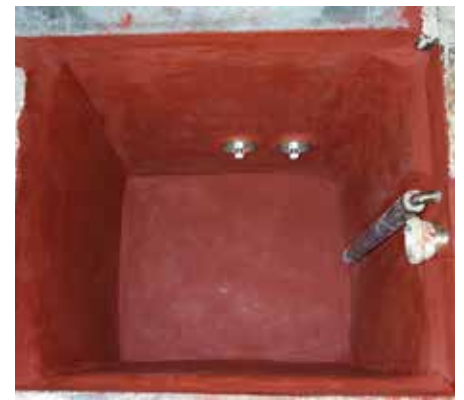
Sumergir después del recubrimiento

Si necesita más información, comuníquese con el representante de Belzona de su localidad: