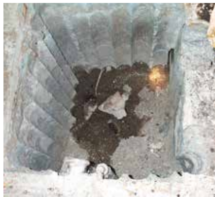
Sumergir antes de la aplicación